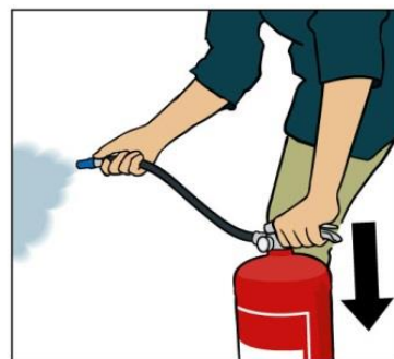
Tryck ner handtaget.